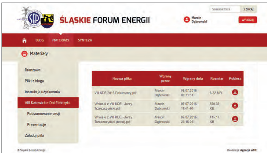
Rys. 4. Zakładka MATERIAŁY umożliwia zamieszczanie plików i dokumentów na portalu, co służy dzieleniem się ciekawymi materiałami ze społecznością portalu. Dodatkowo możliwość tworzenia kategorii pozwala na zbieranie i uporządkowywanie materiałów dotyczących ważnych wydarzeń dla śląskiej energetyki. Ostatnim takim wydarzeniem były VIII Katowickie Dni Elektryki. Na portalu zamieszczono dokumenty dotyczące organizacji VIII KDE, wnioski, podsumowania kolejnych sesji oraz niektóre prezentacje uczestników. Nad ładem i porządkiem całości czuwa administrator