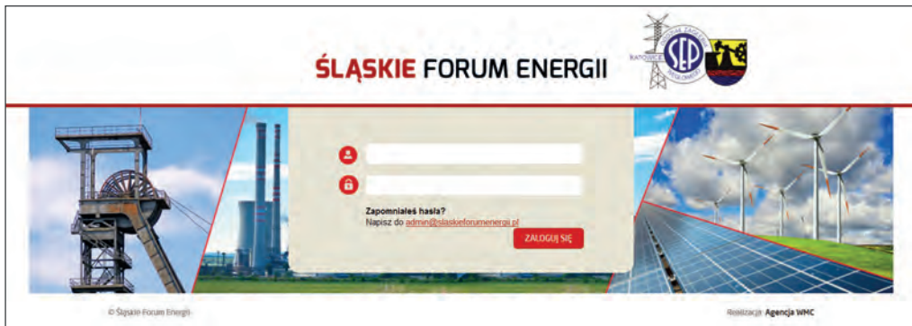
Rys.1. Strona logowania do portalu. Dostęp do portalu wymaga podania loginu i hasła