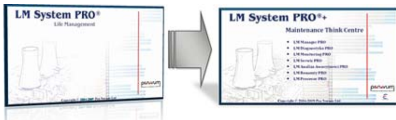
Rys. 2. Platforma LM System PRO ® + zastępuje wdrażany i rozwijany od 5-ciu lat program LM System PRO ®