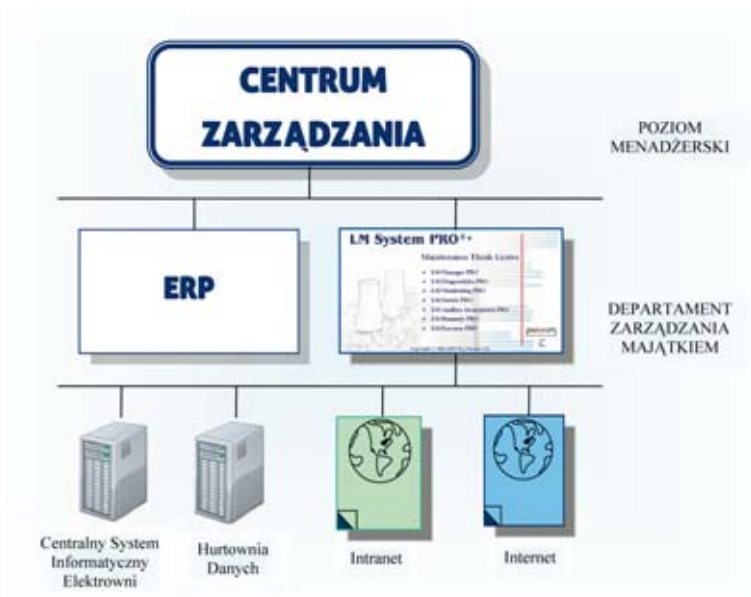
Rys. 4. Ogólna architektura Systemów IT Centrum Zarządzania Grupy Elektrowni