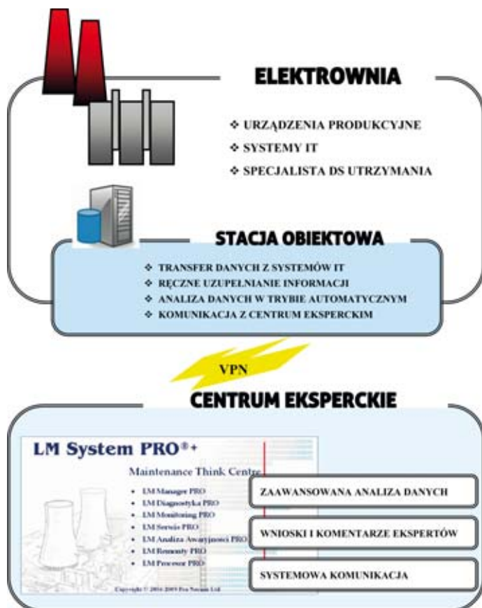
Rys. 5. Integracja elektrowni z Centrum Zarządzania przy pomocy Stacji Obiektowych obsługiwanych przez specjalistę CZ lub/i specjalistę Wydziału Zarządzania majątkiem elektrowni

” Utrzymanie stanu technicznego urządzeń energetycznych także podlega, od pewnego czasu, ewolucji. Główny kierunek tych zmian to wyodrębnienie utrzymania w autonomiczną dziedzinę działalności aż do zakupu usługi w trybie outsourcingu