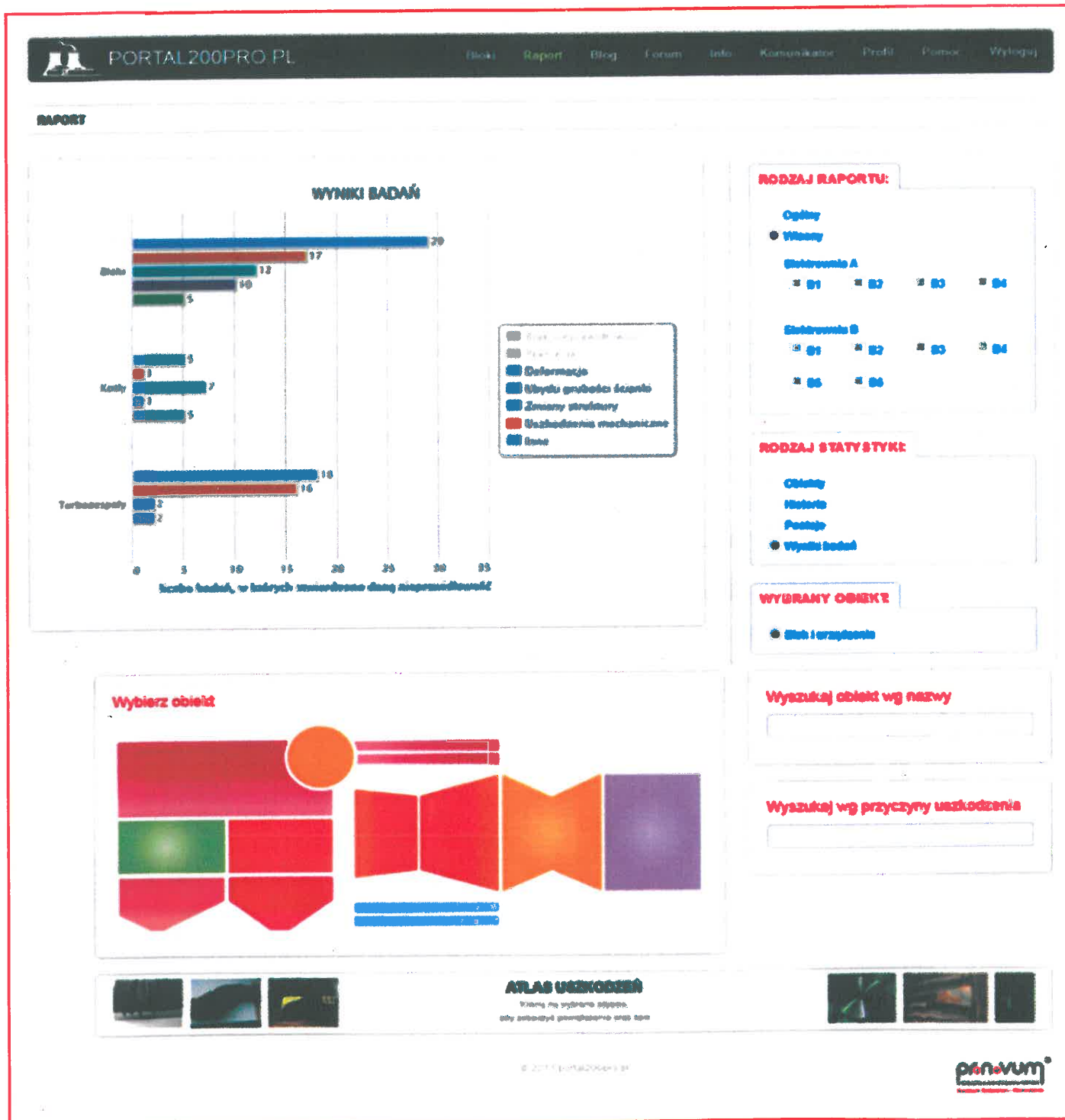
Rys. 2. Portal internetowy www.portal200pro.pl – przykład jednego z interfejsów udostępniającego statystykę uszkodzeń [4].

Dostęp do portalu odbywa się z wykorzystaniem protokołu, który zapewnia szyfrowanie całej transmisji przekazywa-